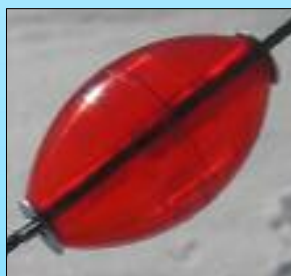
Flotteurs pour les téléskis

Sistemazione dei dispositivi di visualizzazione (secondo il tipo d'infrastrutture)