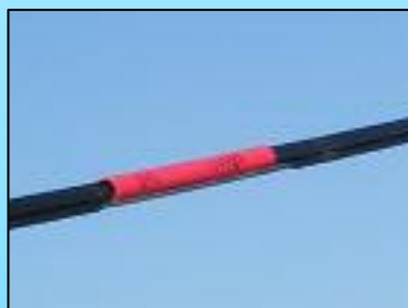
Spirales pour les télésièges Spirali per le seggiove