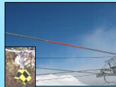
Drapeaux à damier ou peinture rouge discontinue pour les catex